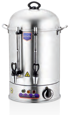
GİZLİ REZİSTANS MODEL